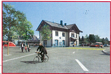
bestehende Gemeindestrasse als neue Kantonsstrasse 72