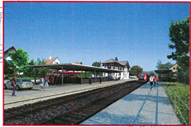
Rad- und Fussgängerunterführung "Unterneuhaus"